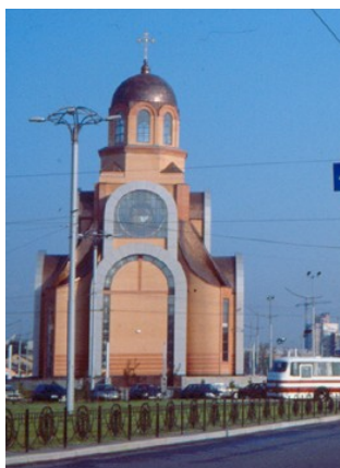
Рис. 1. Церква Георгія Побідоносця для робітників Української залізниці біля Південного вокзалу Києва. 1998–2001 рр., арх. Р. Сивенький. Прототипом стала древньоруська архітектура.

Бароко є однією з найяскравіших сторінок архітектурної спадщини українського народу, цей час асоціюється з періодом відносної незалежності України, періодом героїчної боротьби та активної будівельної діяльності. Архітектура доби бароко – одна з найулюбленіших тем для новітніх архітектурних експериментів у галузі сакрального будівництва. Своєрідними взірцями для розвитку барокової теми стали Михайлівський Золотоверхий собор та Успенський собор Києво-Печерської Лаври. Тема козацького бароко лягла в основу архітектурного вирішення багатьох церков: у с. Зубра біля Львова (1992–1995 р., Р. Сивенький), православної церкви і дзвіниці у с. Брюховичі біля Львова (1996–2002 рр., М. Рибенчук), греко-католицької церкви у с. Бірки біля Львова (1995–2002 рр., М. Рибенчук), рис. 2, церква Вознесіння Господнього у Львові (1993–2002 рр., М. Рибенчук), церкви св. Миколи у с. Чернещина, Харківська обл. (С. Попова) та багатьох інших.