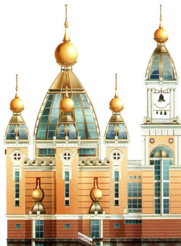
Рис. 7. Храм Різдва Христового у Києві. Арх. І. Авдєєв, Я.Дяченко та ін. Приклад вільної інтерпретації стильового прототипу, у даному випадку барокової спадщини.