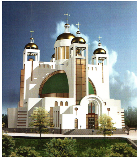
Рис. 5. Кафедральний собор Української греко-католицької церкви у Києві. 2000–2005 рр., арх. М. Левчук.

Архітектура церква побудована на модернізації барокових форм.