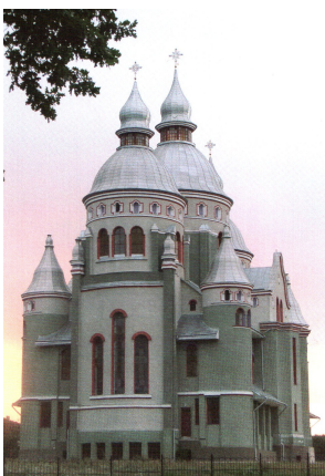
Рис. 2. Греко-католицька церква у с. Бірки біля Львова. 1995–2002 рр., арх. М. Рибенчук. За першоджерело образного вирішення була використана тема українського бароко.