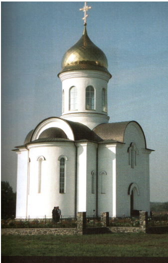
Рис. 6. Церква Віри, Надії та Любові у с. Порадівка Черкаської обл. Арх. Ю.Лосицький Приклад прямого відтворення, точної історичної стилізації пам'ятки древньоруської архітектури.